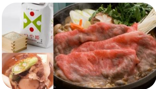
(満喫プランセットのイメージ)