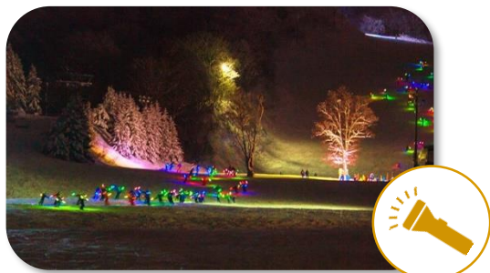
(「1,000人松明滑走」の様子)