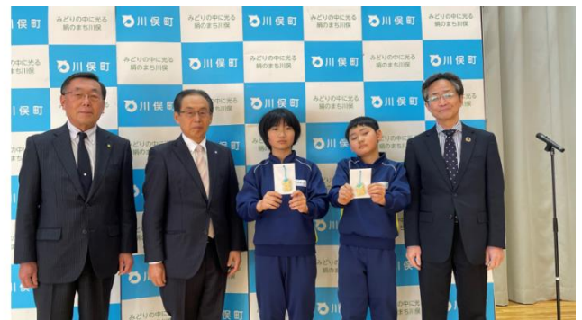
〈見守り端末贈呈式の様子〉