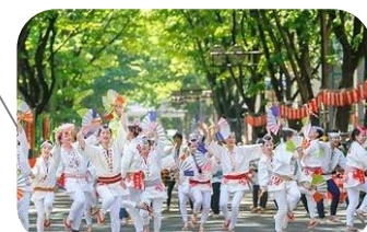
仙台青葉まつり(宮城県仙台市)