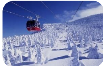
蔵王樹氷まつり(山形県山形市)