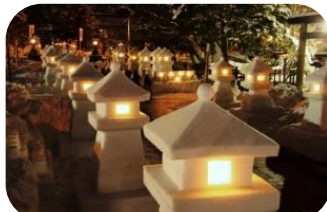
上杉雪灯籠まつり(山形県米沢市)