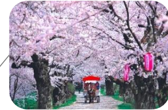
展勝地さくらまつり(岩手県北上市)