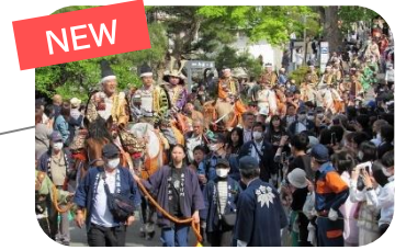
藤原まつり(岩手県平泉町)