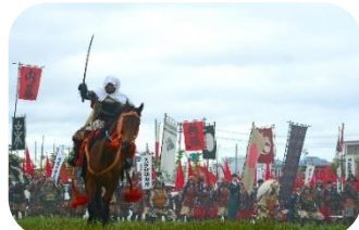
上杉まつり(山形県米沢市)