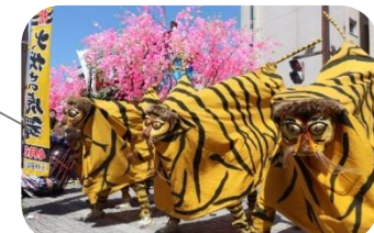
初午まつり 火伏せの虎舞(宮城県加美町)