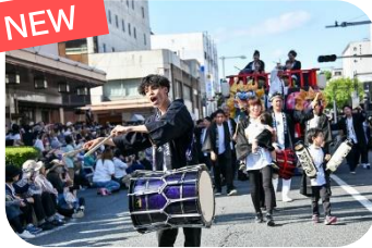
酒田まつり(山形県酒田市)